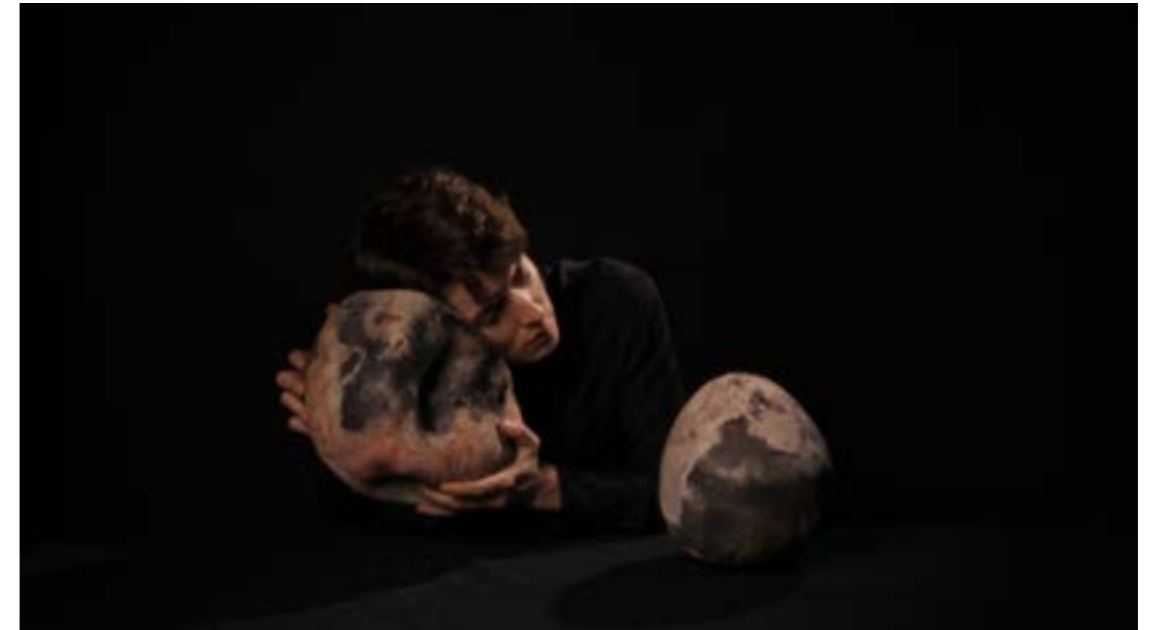
Still , Camille Sauer, 2026, Vidéo, @Camille Sauer, ADAGP, Paris, 2026

>> Samedi 28 février 2026 à 14h30 : prise de parole officielle, vernissage, cocktail.