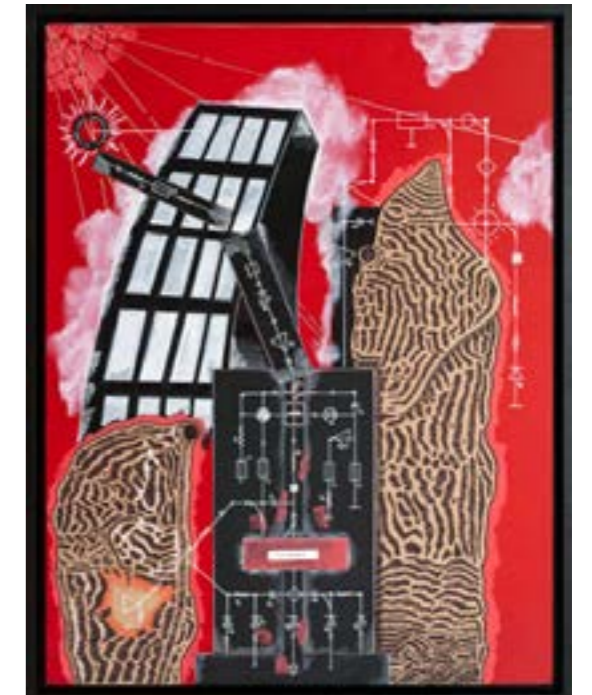
Matière Noir , Camille Sauer, 2026, Dessins, @Camille Sauer, ADAGP, Paris, 2026