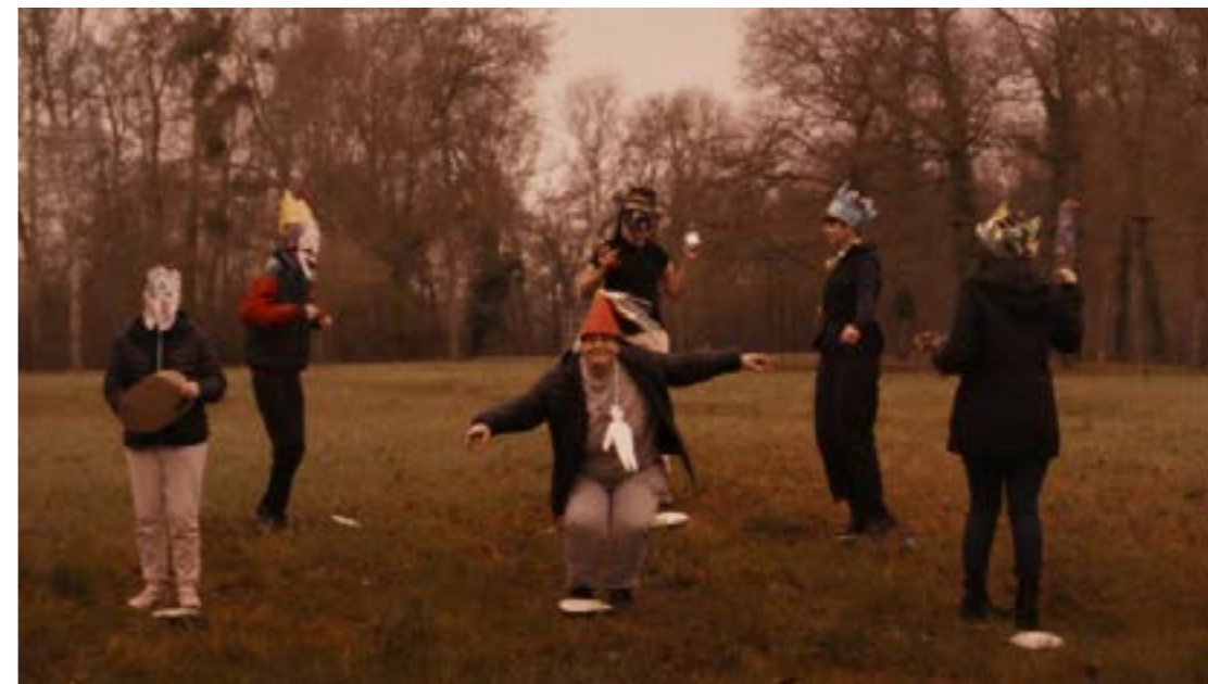
Still, Camille Sauer, 2026, Vidéo

Matière noire est le fruit d'un processus de création collectif mené avec plusieurs structures du territoire. Le film intègre des contributions issues de collaborations avec l'Institut Médico-Éducatif André Neulat, l'École municipale de musique d'Amilly, l'APAGEH - Chantiers d'Insertion pour l'Environnement, l'EHPAD La résidence du Château de la Manderie, l'Association EcoloKaTerre, ainsi que la Fédération des Aveugles et Amblyopes de France Val de Loire. Ces collaborations irriguent l'oeuvre de gestes, de voix, de récits et de présences multiples, inscrivant le film et l'exposition dans une expérience partagée, sensible et située.