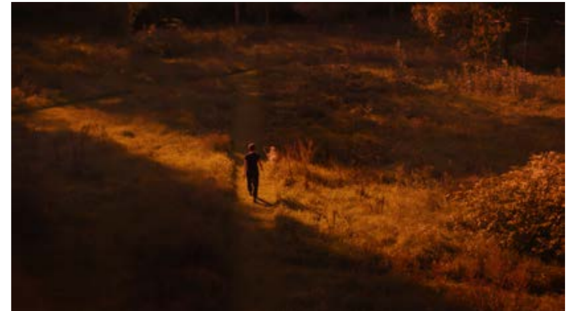
Still , Camille Sauer, 2026, Vidéo, @Camille Sauer, ADAGP, Paris, 2026