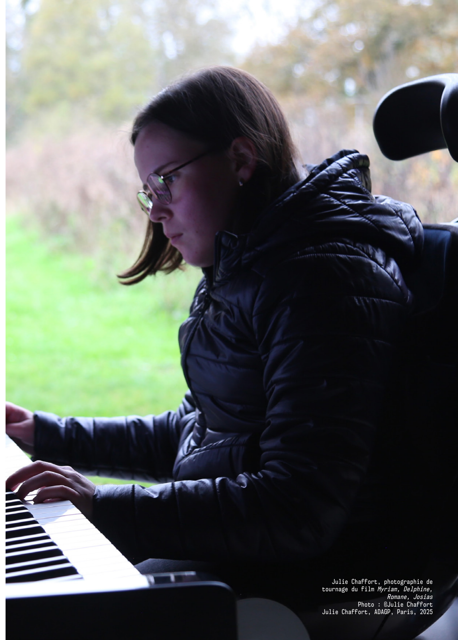
Julie Chaffort, photographie de tournage du film Myriam, Delphine, Romane, Josias Photo : @Julie Chaffort Julie Chaffort, ADAGP, Paris, 2025