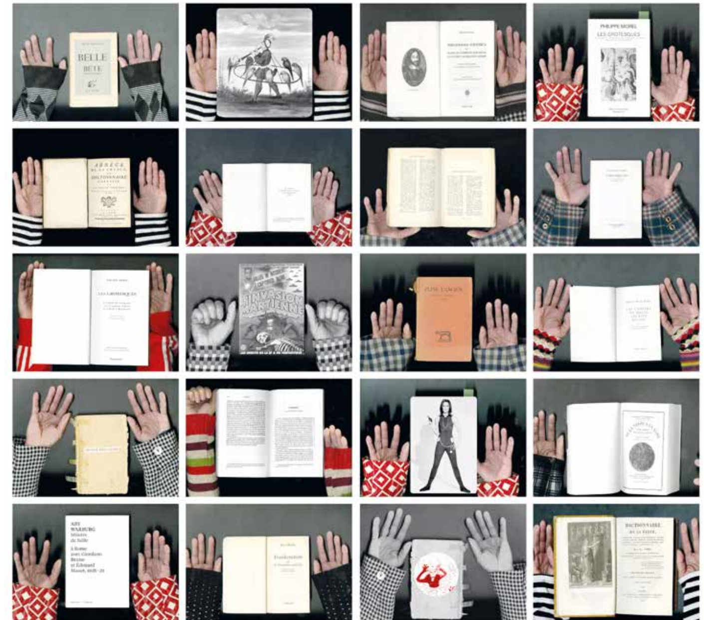
Hélène Delprat LE JOUR OÙ J'AI INVENTÉ LES FEMMES SAVANTES , 2010 Tirages numériques pigmentaires sur papier prestige. 178,7 x 100 cm (x2) Edition of 3 and 1 HC (#2/3) © Hélène Delprat, ADAGP, Paris, 2023

Ses œuvres ont également été exposées, entre autres, au Musée Gustave Moreau, au Jeu de Paume et au Centre Georges Pompidou, à Paris, pour le Festival Hors-Pistes.