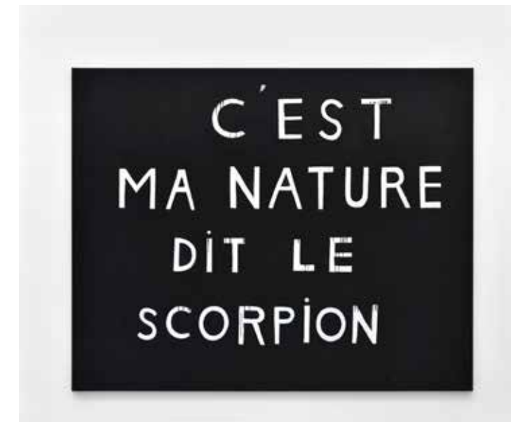
Hélène Delprat C'EST MA NATURE DIT LE SCORPION , 2020 Pigment, liant acrylique sur toile 199 x 247 cm © Photo: Rebecca Fanuele Courtesy de l'artiste et de la Galerie Christophe Gaillard © Hélène Delprat, ADAGP, Paris, 2023