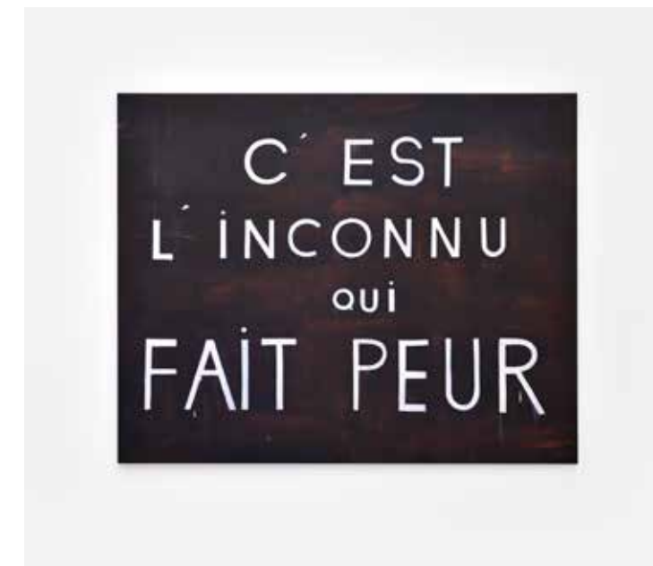
Hélène Delprat C'EST L'INCONNU QUI FAIT PEUR , 2020 Pigment, liant acrylique sur toile 199 x 247 cm © Hélène Delprat, ADAGP, Paris, 2023

Navette bus Paris < > Tanneries Aller : départ depuis Paris à 12h (place Denfert-Rochereau) Retour : départ depuis Les Tanneries à 20h Navette bus Gare de Montargis < > Tanneries Aller : départ depuis la gare de Montargis à 15h10 Retour : départ depuis Les Tanneries à 17h30 - Infos et réservations avant le 1 er juin 02.38.85.28.50 / contact-tanneries@amilly45.fr