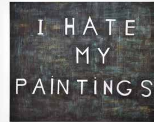
Hélène Delprat I HATE MY PAINTINGS , 2020 Pigment, paillettes, liant acrylique sur toile 199 x 247 cm © Hélène Delprat, ADAGP, Paris, 2023