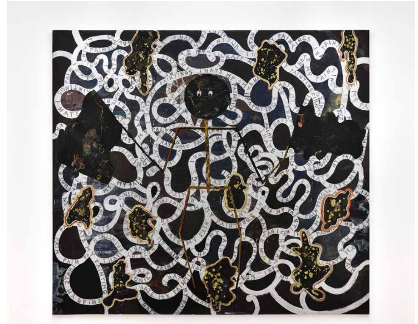
Hélène Delprat I HATE MY PAINTINGS , 2020 Pigment, paillettes et liant acrylique sur papier marouflé sur toile 237 x 263 cm © Hélène Delprat, ADAGP, Paris, 2023