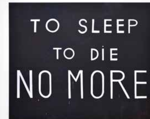
Hélène Delprat TO SLEEP TO DIE NO MORE , 2020 Pigment, liant acrylique sur toile 199 x 247 cm © Photo: Rebecca Fanuele Courtesy de l'artiste et de la Galerie Christophe Gaillard © Hélène Delprat, ADAGP, Paris, 2023