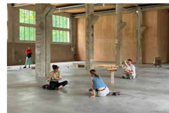
(F)estivales 2022, Ensemble Körperz