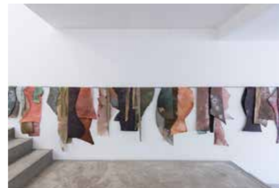
Natalia Jaime-Cortez, One line , encre sur papier déposé sur tige de métal, 2022 Photo : Richard Müller Courtesy de l'artiste et des Tanneries - CAC, Amilly © ADAGP, Paris, 2022

* Le daftar , Vir Andres Heras, Petite Galerie et Verrière, visible jusqu'au 28 mai 2023