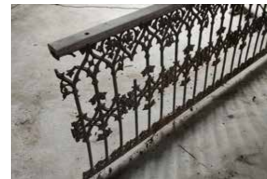
Collectif CLARA, Courtesy des artistes et des Tanneries - CAC, Amilly