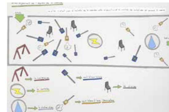
Victor Cord'homme, Proposition pour la Verrière, Courtesy de l'artiste et des Tanneries - CAC, Amilly