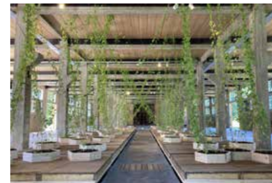
Abraham Cruzvillegas Vue de l'exposition EcJat Grande Halle Photo : Les Tanneries - CAC, Amilly, 2022