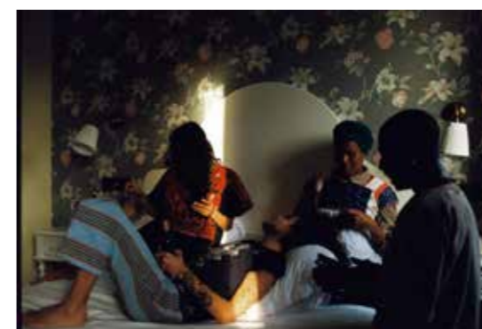
Vir Andres Hera, Le Daftar , extrait du film 16mm