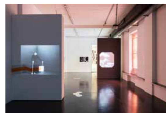
Meris Angioletti, Forme-pensiero , Vue de l'installation à la galerie d'art contemporain de Milan, Otto Zoo