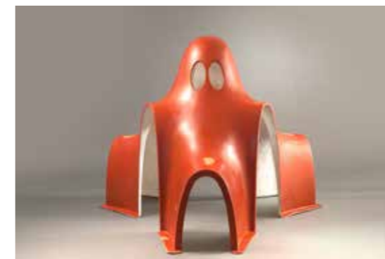
Les Simonnet, Fantôme , Courtesy des artistes et des Tanneries - CAC, Amilly