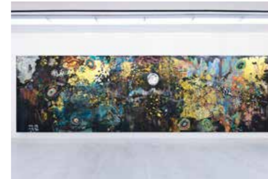
Hélène Delprat, Ce que le chevalier a couvert de cendres à son retour , 2015