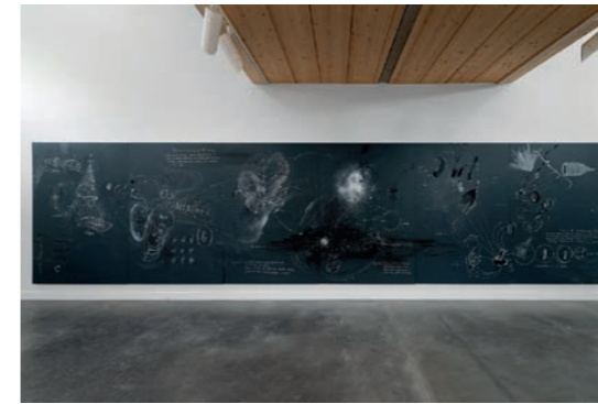
Nikolaus Gansterer Figuring Figures , 2019 Vue de l'exposition Figures de pensée / Denkbewegungen Galerie Haute Les Tanneries - CAC, Amilly, 2021

Pour ce faire, Nikolaus Gansterer et Klaus Speidel transforment l'art en un véritable appareil critique au sein duquel les hypothèses se dessinent ( Drawing a Hypothesis , 2012), les instruments sont à dess(e)ins ( Untitled Drawing Instrument , 2013), les graphiques et autres diagrammes sont utilisés pour rendre compte de la réalité de figures choré-graphiques ( Choreo-graphic Figures Diagrams , 2019) et les couleurs échantillonnées en fonction des souvenirs ou des émotions qu'elles ravivent ( Colour Field Studies , 2019-2021).