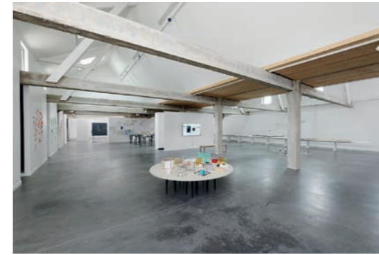
Nikolaus Gansterer & Klaus Speidel Figures de pensée / Denkbewegungen Vue d'exposition Galerie Haute Les Tanneries - CAC, Amilly, 2021