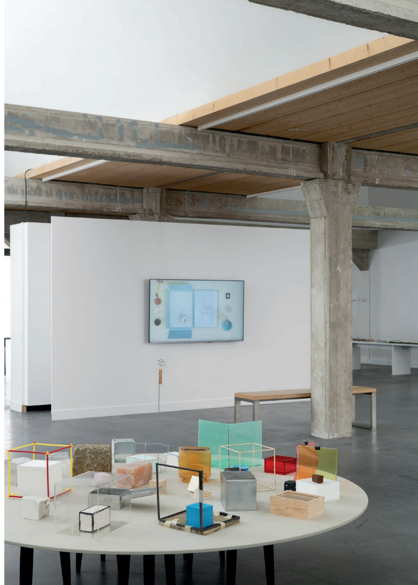
Nikolaus Gansterer & Klaus Speidel Figures de pensée / Denkbewegungen Vue d'exposition Galerie Haute Les Tanneries - CAC, Amilly, 2021

Emerging Artists , Collection Essl, Klosterneuburg, DE