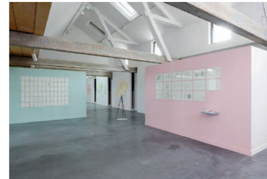
Nikolaus Gansterer & Klaus Speidel Figures de pensée / Denkbewegungen Vue d'exposition Galerie Haute Les Tanneries - CAC, Amilly, 2021