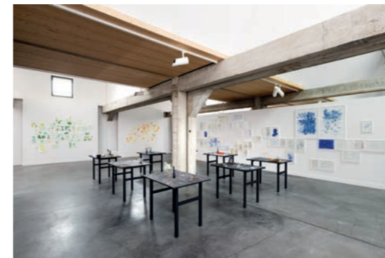
Nikolaus Gansterer & Klaus Speidel Figures de pensée / Denkbewegungen Vue d'exposition Galerie Haute Les Tanneries - CAC, Amilly, 2021