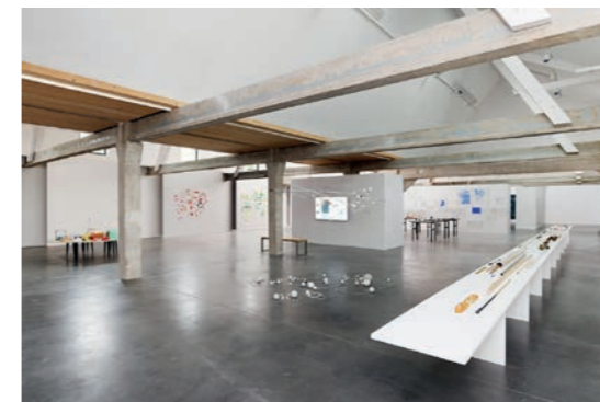
Nikolaus Gansterer & Klaus Speidel Figures de pensée / Denkbewegungen Vue d'exposition Galerie Haute Les Tanneries - CAC, Amilly, 2021