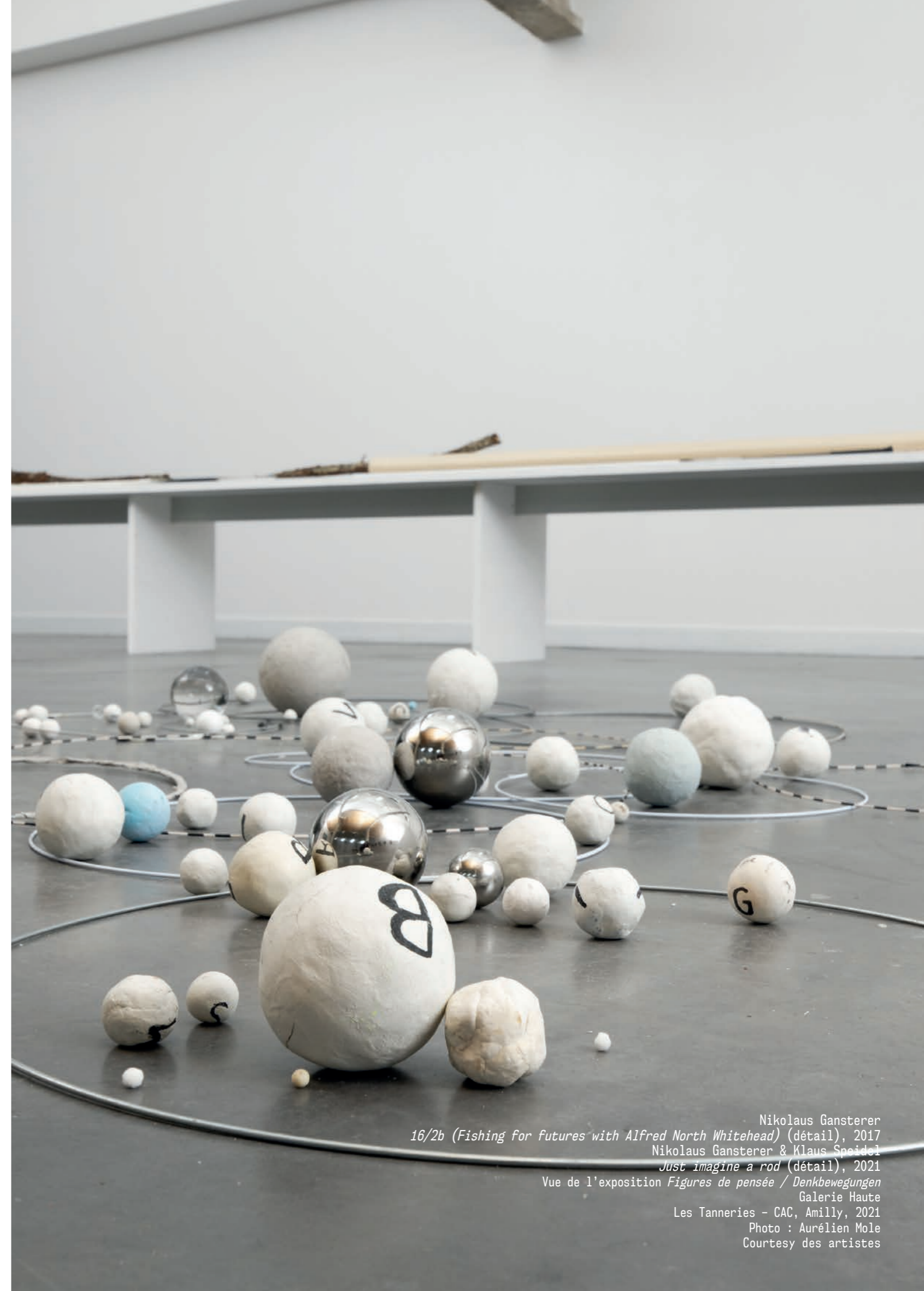
Nikolaus Gansterer 16/2b ( Fishing for futures with Alfred North Whitehead ) (détail), 2017 Nikolaus Gansterer & Klaus Speidel Just imagine a rod (détail), 2021 Vue de l'exposition Figures de pensée / Denkbewegungen Galerie Haute Les Tanneries - CAC, Amilly, 2021

>> La plupart de ses publications sont consultables ici : http://klausspeidel.com !