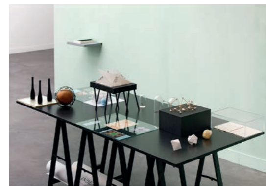
Nikolaus Gansterer Table of Contents , 2012 Vue de l'exposition Figures de pensée / Denkbewegungen Galerie Haute Les Tanneries - CAC, Amilly, 2021