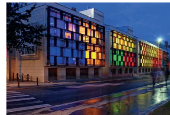
École supérieure d'Art et de Design d'Orléans