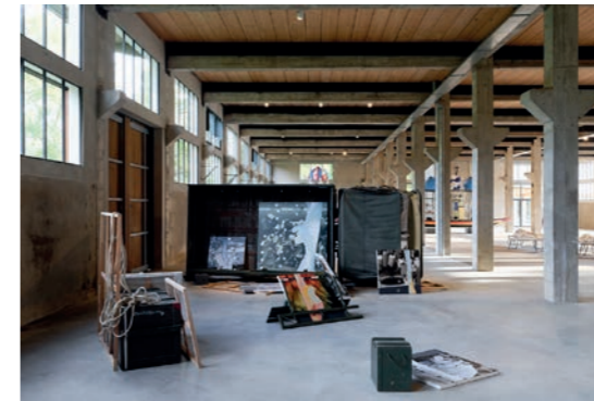
Lucy + Jorge Orta (respectivement nés en 1966 à Sutton Coldfield, Royaume-Uni et en 1953 à Rosario, Argentine ; vivent et travaillent en région parisienne) Vue de l'exposition Interrelations