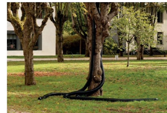
Ludovic Chemarin@ Parasite , 2020 Vue de l'exposition Ludovic Photo : Aurélien Mole Courtesy de l'artiste et des Tanneries - CAC, Amilly