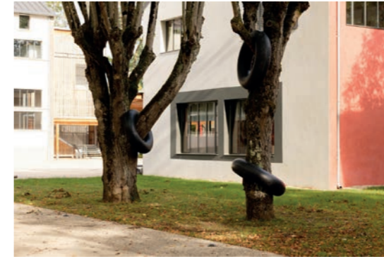
Ludovic Chemarin@ Ronds dans les arbres , 2020 Vue de l'exposition Ludovic

À la faveur d'un dispositif en miroir ou encore en négatif, l'artiste-source - pour l'heure réactivé - instaure un dialogue entre les vides et les pleins, ce qui est visible et ce qui ne l'est pas (encore), la forme et l'informe et fait par ailleurs émerger un double système d'écho à ses créations antérieures, que ce soit directement, par le biais du souvenir que le regardeur pourrait en avoir ( Pots d'herbe , Parasite bouée , Chaise bouée et Chaise bouée sur l'eau - 1998) ou encore indirectement, par la présence à proximité des œuvres de Ludovic Chemarin@ qui en sont autant de réactivations ( Parasite , 2020), d'adaptations ( Ronds dans les arbres , 2020) et de réinterprétations ( Pots d'herbe , 2020).