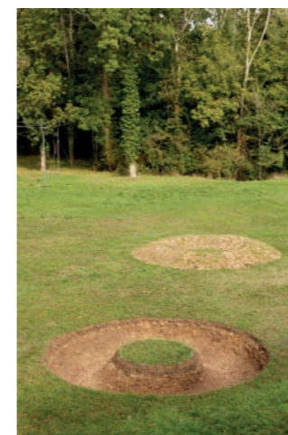
Ludovic Chemarin@ L'Île , 2020 Vue de l'exposition Ludovic