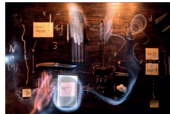
Nikolaus Gansterer (né en 1974 à Vienne où il vit et travaille) & Klaus Speidel (docteur en philosophie de l'art, artiste et théoricien) Visuel officiel de l'exposition Figures de pensées Photo : Nikolaus Gansterer & Klaus Speidel Courtesy des artistes et des Tanneries - CAC, Amilly

29 mai 2021 : conversation publique avec Nikolaus Gansterer et Klaus Speidel