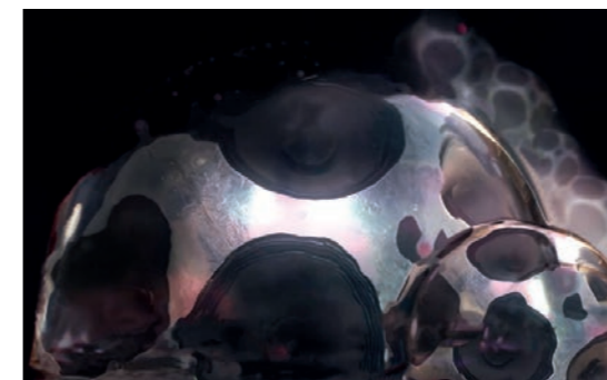
Cylix (née en Allemagne, vit et travaille à Berlin) 16bitwolf , 2020 Visuel de travail - Projet en cours