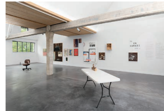
Benoît Maire (né en 1978 à Pessac, vit et travaille à Bordeaux) Vue de l'exposition IN HAWAII Photo : Aurélien Mole Courtesy de l'artiste et des Tanneries - CAC, Amilly © ADAGP, Paris, 2020