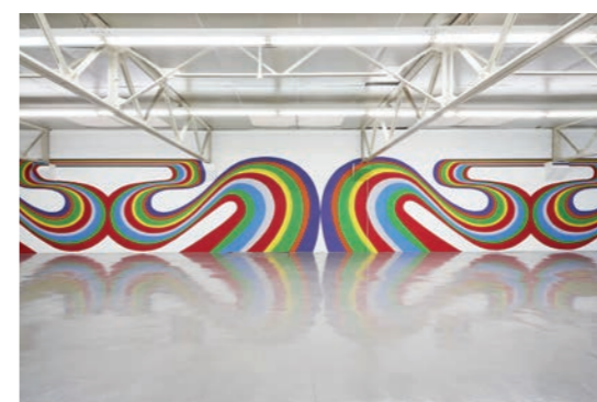
Élodie Lesourd Solution #8 , 2018 Vue de peinture murale in situ Printemps de Septembre, Lieu-Commun, Toulouse