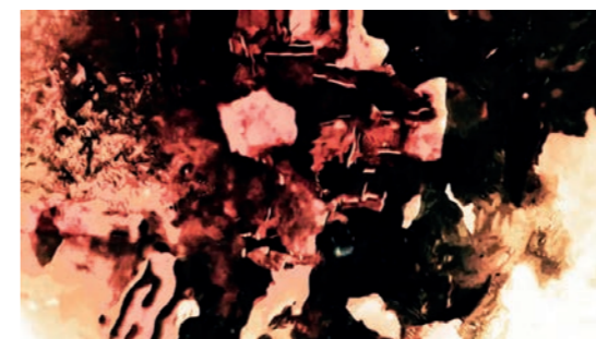
Cylix (née en Allemagne, vit et travaille à Berlin) 16bitwolf , 2020 Visuel de travail - Projet en cours