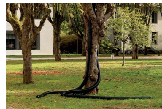
Ludovic Chemarin@ (entité créée en 2011) Parasite , 2020 Vue de l'exposition Ludovic Photo : Aurélien Mole Courtesy de l'artiste et des Tanneries - CAC, Amilly