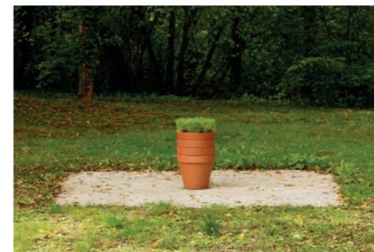
Ludovic Chemarin@ Pots d'herbe , 2020 Vue de l'exposition Ludovic