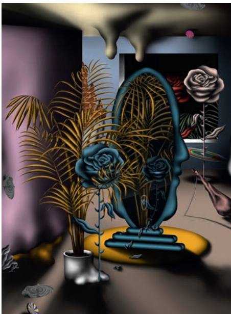
Ludovic Chemarin@ Paysage Kentia 2019 impression numérique sur papier dimensions variables illustration de Laura Kopf réalisée sur invitation de Ludovic Chemarin@