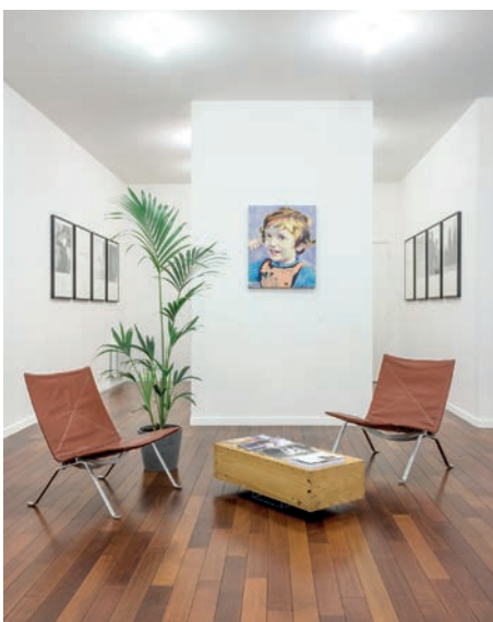
Ludovic Chemarin@ Salon@ 2019 vue de l'exposition Moments , galerie mfc-michèle didier, 2019 premier plan : Salon@ ( contrat ) au mur : Ludovic Chemarin enfant sur fond bleu (peinture de Gaël Davrinche)