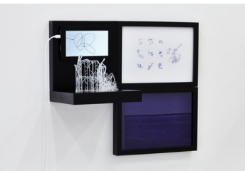
Anne-Valérie Gasc, Surface Tension (Inachevés) , 2016 série de 10 polyptyques, techniques mixtes