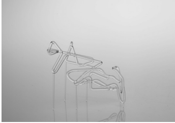
Anne-Valérie Gasc, L'original transparent , 2018 série de 10 volumes en verre, travail réalisé en partenariat avec le CIAV de Meisenthal