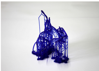
Anne-Valérie Gasc, Doodle Monuments 2 , 2016-18 série de 10 volumes, impression stéréolithographique en 3D, résine calcinable