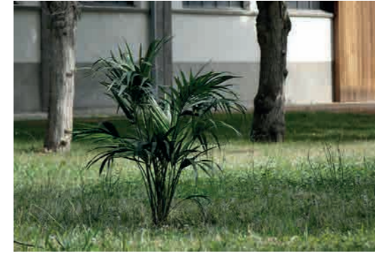
Ludovic Chemarin@ Kentia@ , 2020 Vue de l'exposition Ludovic

À la faveur d'un dispositif en miroir ou encore en négatif, l'artiste-source - pour l'heure réactivé - instaure un dialogue entre les vides et les pleins, ce qui est visible et ce qui ne l'est pas (encore), la forme et l'informe et fait par ailleurs émerger un double système d'écho à ses créations antérieures, que ce soit directement, par le biais du souvenir que le regardeur pourrait en avoir ( Pots d'herbe , Parasite bouée , Chaise bouée et Chaise bouée sur l'eau - 1998) ou encore indirectement, par la présence à proximité des œuvres de Ludovic Chemarin@ qui en sont autant de réactivations ( Parasite , 2020), d'adaptations ( Ronds dans les arbres , 2020) et de réinterprétations ( Pots d'herbe , 2020).