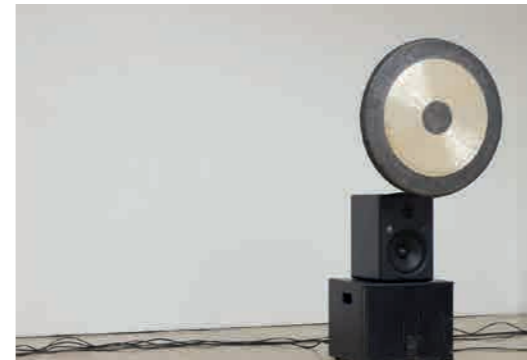
Francesco Fonassi (né en 1986, vit et travaille entre Brescia et Venise) Gong solo , 2013 Vue d'exposition à la BB15, 2013 Photo : BB15 Courtesy de l'artiste