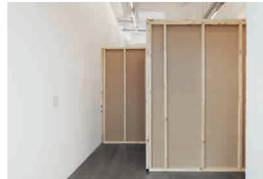
Leander Schönweger (né en 1986 à Merano, Italie, vit et travaille à Vienne) Something Steers Us Both , 2019 Œuvre produite avec le soutien du WIELS | Contemporary Art Centre et d'Autonome Provinz Bozen-Südtirol