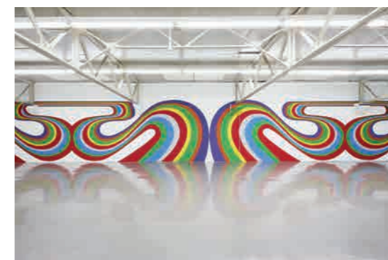
Élodie Lesourd Solution #8 , 2018 Vue de peinture murale in situ Printemps de Septembre, Lieu-Commun, Toulouse