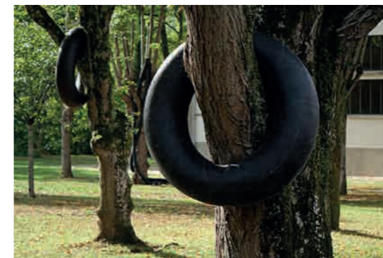
Ludovic Chemarin@ Ronds dans les arbres , 2020 Vue de l'exposition Ludovic