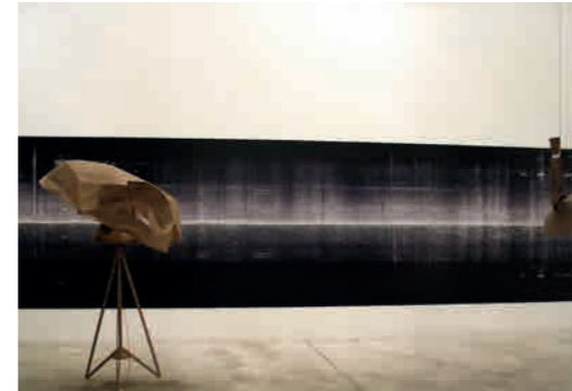
Bernhard Rüdiger (né en 1964 à Rome, vit et travaille à Paris) Vue d'exposition, 2004 Galerie Michel Rein Photo et courtesy de l'artiste © ADAGP, Paris, 2020

>> Retrouvez le fil de la programmation sur : http://www.lestanneries.fr/agenda/