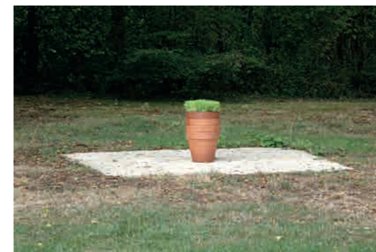
Ludovic Chemarin@ Pots d'herbe , 2020 Vue de l'exposition Ludovic