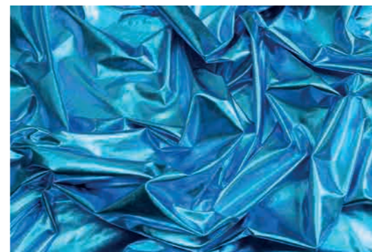
Martine Aballéa (née en 1950 à New York, vit et travaille à Paris) Visuel officiel de l'exposition Résurgence