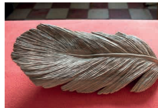
Michala Julinyova (née en 1991 à Trenčín, Slovaquie, vit et travaille à Lyon) Sans titre (titre de travail), 2020 Vue d'atelier