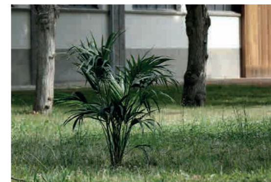
Ludovic Chemarin@ Kentia@ , 2020 Vue de l'exposition Ludovic