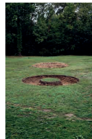
Ludovic Chemarin@ L'Île , 2020 Vue de l'exposition Ludovic