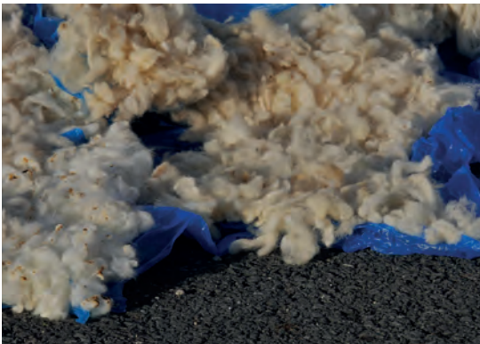
Ouassila Arras Mise en chantier (détail), 2019 Work in progress , La Fileuse - Friche artistique, Reims, 2019