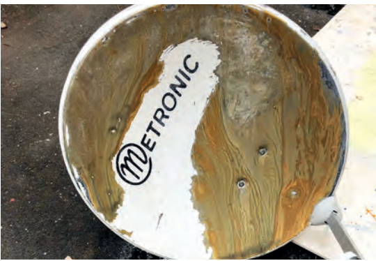
Ouassila Arras Les Voisines (détail), 2019 Installation Vue d'installation, La Fileuse - Friche artistique, Reims, 2019