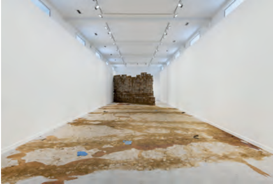
Ouassila Arras Déplacements , 2018 Installation Vue d'exposition, Plein Jeu #2 , FRAC Champagne-Ardenne, 2019