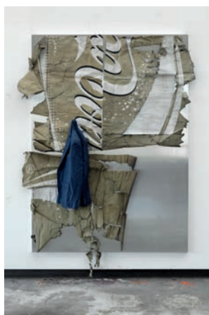
Éric Baudart R 2019 Tableau Aluminium, bâche, PVC 225 x 175 x 5 cm