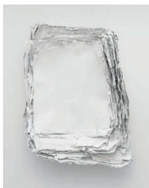
Éric Baudart conCav UltraWhite 2019 Sculpture Acier, papier, peinture, résine 160 x 120 x 40 cm