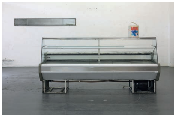
Éric Baudart Time's gone dim 2019 Sculpture Acier, verre, marbre, plastique 250 x 130 x 130 cm